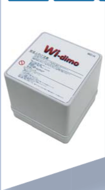
アンテナユニット WD-H サイズ: 100×100×100mm