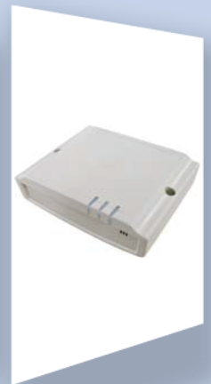
時限解除器 IN-RAT-S サイズ: 140×110×38.5mm