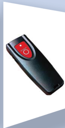
ハンディリセッター IN-A2-RST サイズ: 105×40×15mm