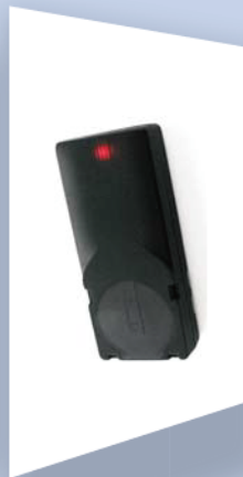
Wi-dimoタグ WD-M-AT サイズ: 58×25×11mm