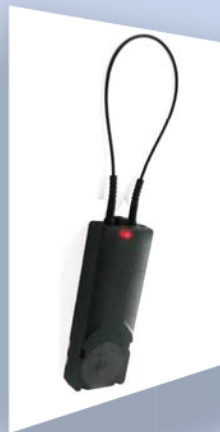
Wi-dimoタグ WD-M-WI サイズ: 70×25×11mm